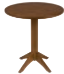
LONDON _ pg 34