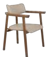
MARUJA _ pg 17