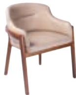
PORTO _ pg 25