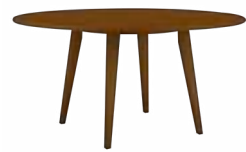
LONDON _ pg 35