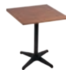
PIAZZA _ pg 43