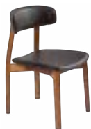
ÇAIRÉ _ pg 16