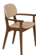
LONDON _ pg 33