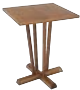
MARUJA _ pg 19