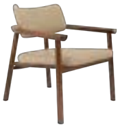
MARUJA _ pg 17