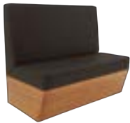
BOOTHS _ pg 39