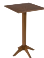
LONDON _ pg 34