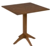
LONDON _ pg 34