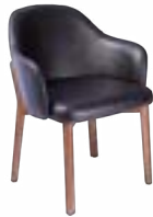
PORTO _ pg 25