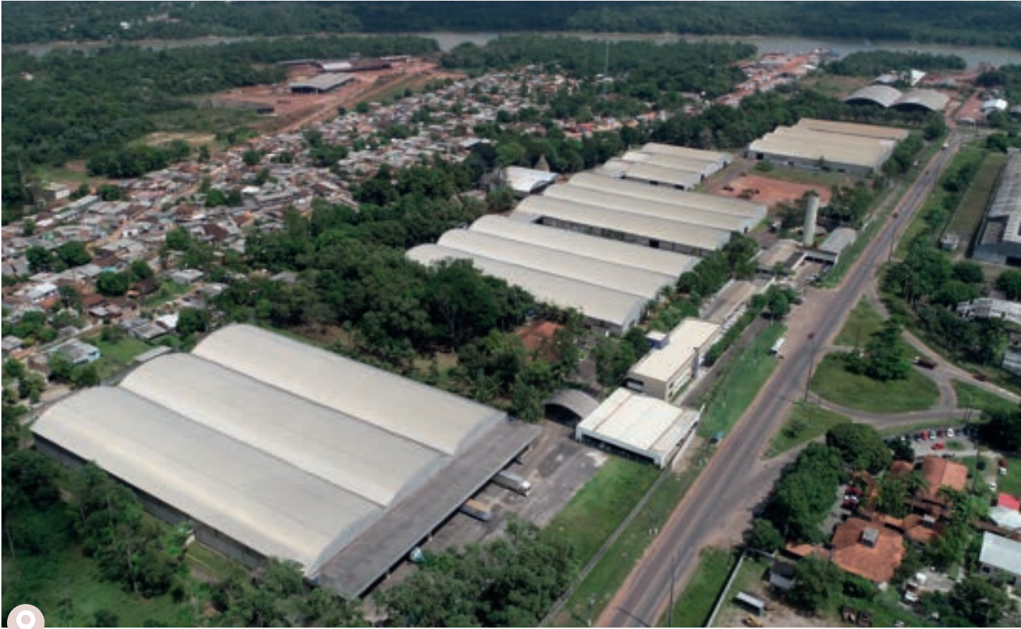
Unidade Fabril BELÉM | BELEM'S Plant | Unidad fabril BELÉM