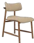
MARUJA _ pg 16