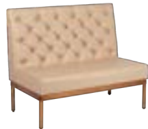
BOOTHS _ pg 39