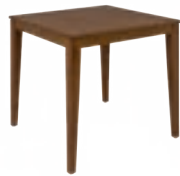
LONDON _ pg 35