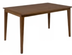
LONDON _ pg 35